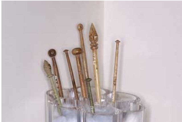
Eine kleine Kollektion römischer Haarnadeln