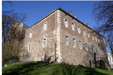
Eingang zum Museum über die Treppe rechts im Bild

Download: Plakat der Thermenausstellung (PDF, ca. 1MB)